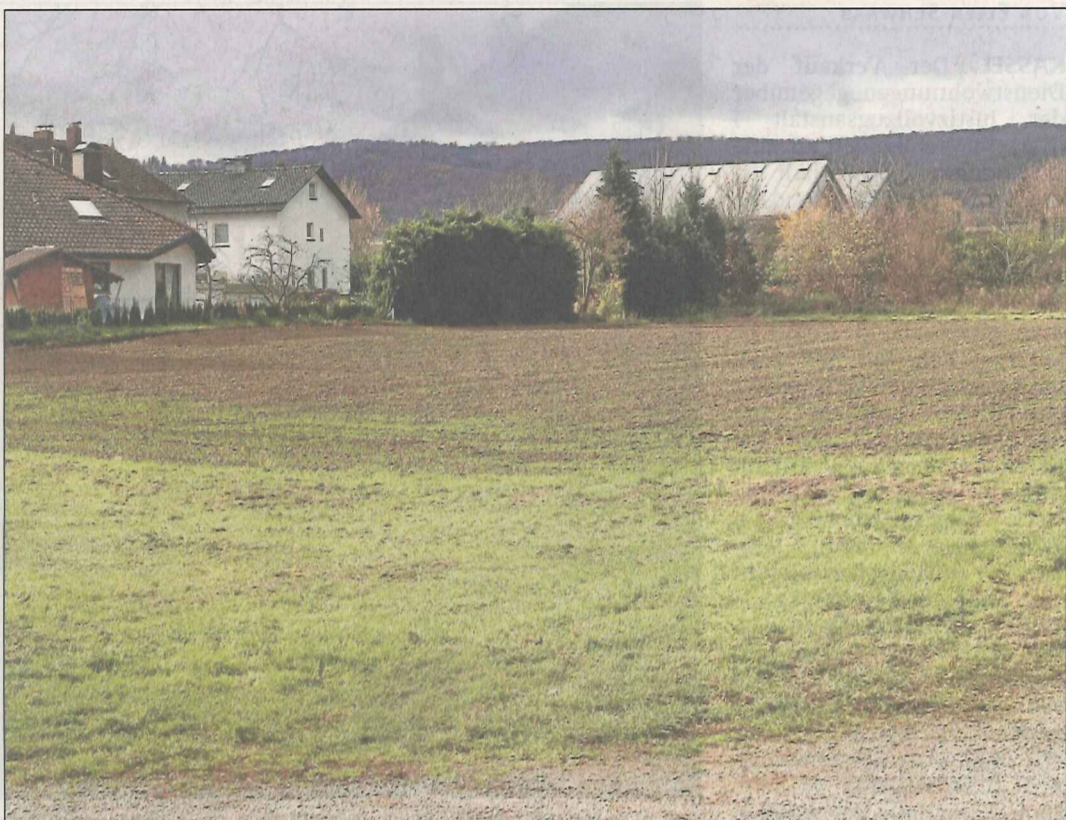
Hier wird demnächst gebaut: Früher waren die Flächen für das neue Baugebiet an der Straße Zum Feldlager teilweise Felder der Versuchsanstalt.

Als „gute Entwicklungsfläche für Wohnbauland“ bezeichnete Petra Gerhold vom städtischen Amt für Stadtplanung und Bauaufsicht das Areal zwischen der Straße Zum Feldlager an der Bahntrasse und der Niederfeldstraße. Während der jüngsten Ortsbeiratssitzung in Harleshausen präsentierte sie die Pläne und gab den Startschuss für eine frühzeitige Bürgerbeteiligung. „Im übernächsten Jahr kann es dort schon mit Bauen losgehen“, sagte Gerhold. Vorgesehen sind klassische Einfamilienhäuser. Auf 20 Prozent der Fläche soll eine Reihenhausbebauung entstehen. Die Bauhöhe müsse sich am Bestand orientieren. Die Erschließung geschehe „verträglich und sicher“ und unter Berücksichtigung der bestehenden Verkehrswege.